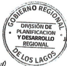
JEFE DE DIVISIÓN DE PLANIFICACIÓN Y DESARROLLO REGIONAL GOBIERNO REGIONAL DE LOS LAGOS.